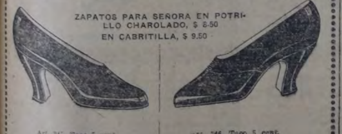
ZAPATOS PARA SEÑORA EN PONTILO CHAROLADO, $ 8.50 EN CABRITILLA, $ 9.50